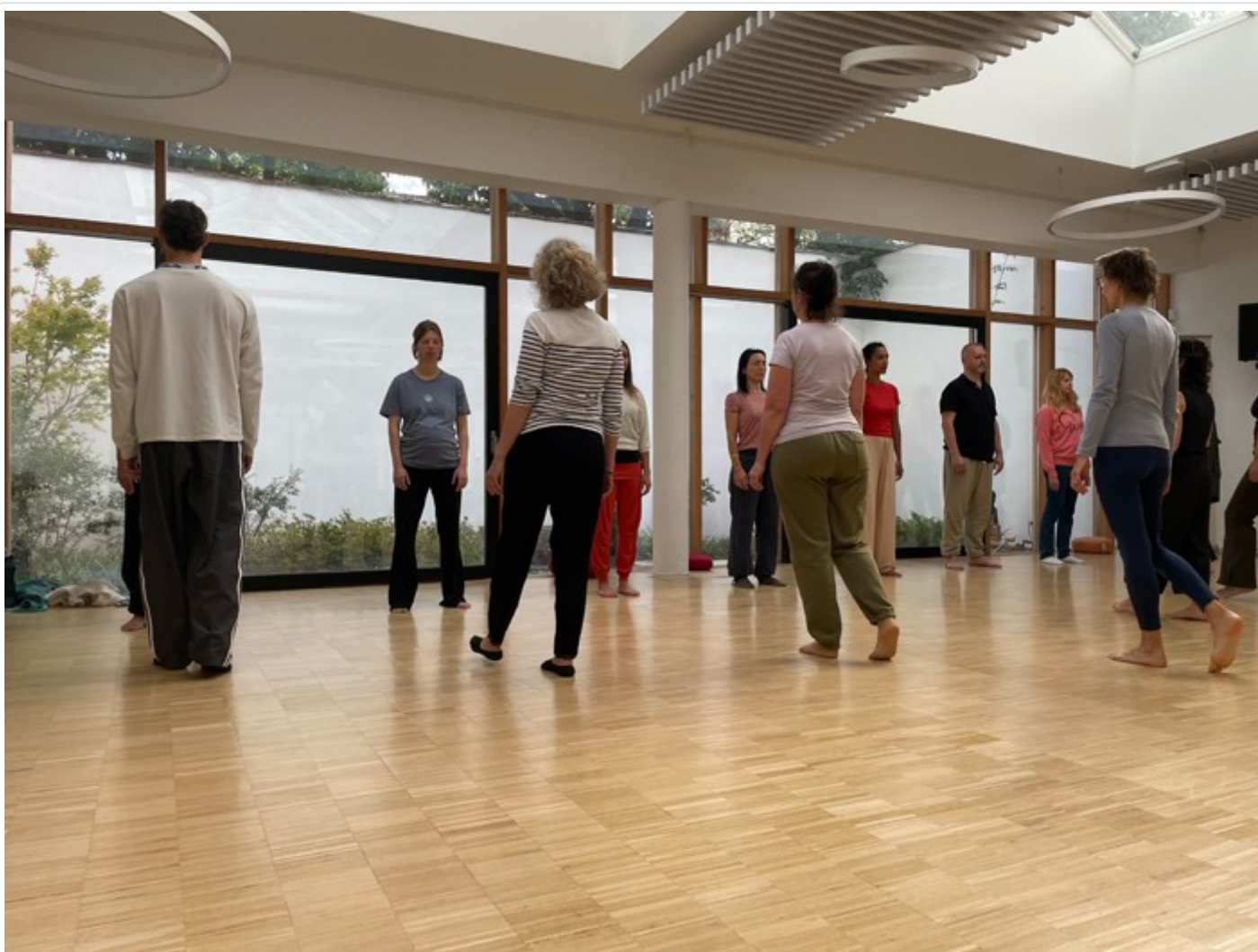
( https://www.espaceinfirmier.fr/images/2dd/d8c49e489e4c2452f2d24e11e6d57/INF06603201f004.jpg )