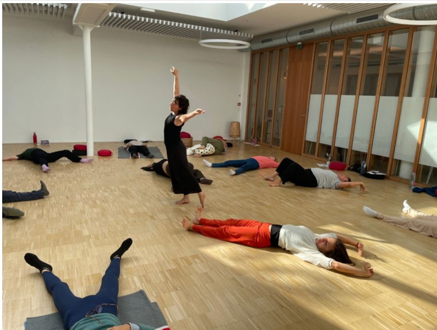
( https://www.espaceinfirmier.fr/images/7ab/1521f65a2839ace6db8eb9b7deded/INF06603201f002.jpg )