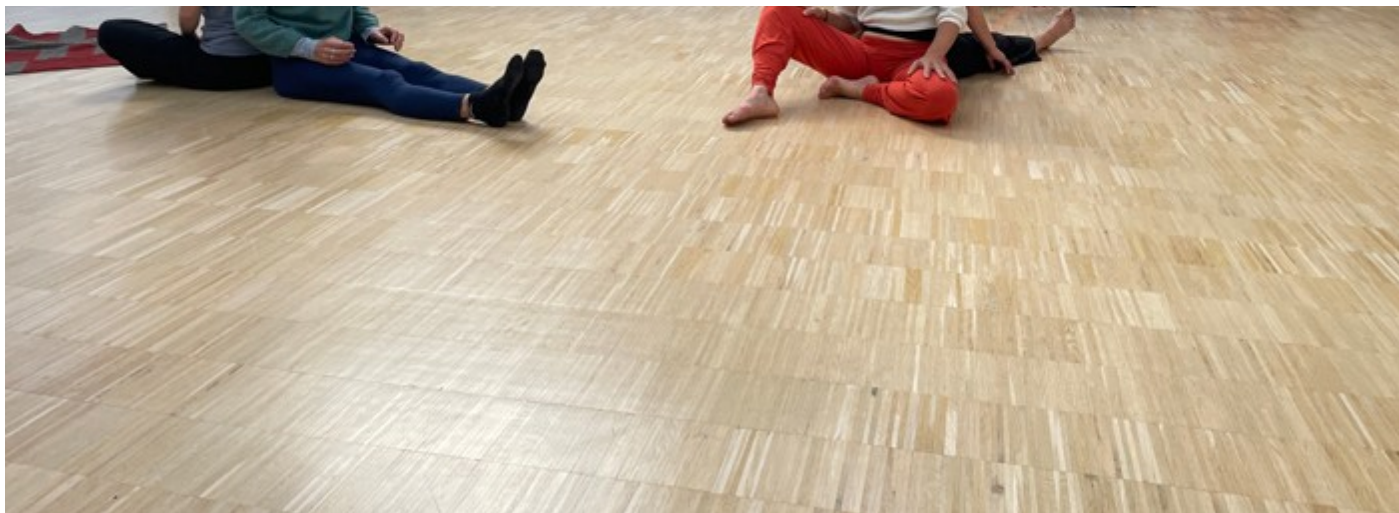
( https://www.espaceinfirmier.fr/images/95c/c60b4869efeb6e80d606f71e4c0a4/INF06603201f003.jpg )